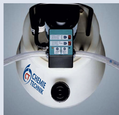
Zmiana kierunku automatyczna