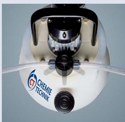
Zmiana kierunku ręczna

Niszczą osady po obu stronach obiegu wody przez co proces odkamieniania następuje samoczynnie, nawet przy prawie całkowicie zablokowanych rurach wymiennika ciepła.